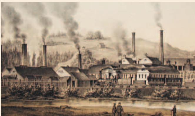
Historisches Bild der Königin-Marien-Hütte Cainsdorf, Traditionszimmer

Konzentriert bereitet sich der Förderverein auf seine Mitgliederversammlung am 9. Mai 2023 im Turnerheim vor. Neben der Rechenschaftslegung soll es vor allem darum gehen, den Blick auf das Kommende zu richten und der Frage nachzugehen, wie können wir unser TH weiterentwickeln und es zu einem sozialen und kulturell-sportlichen Zentrum werden zu lassen.