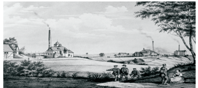
Ansicht der drei o.g. Schächte