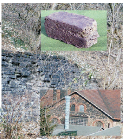
Auch die eigenen Betriebsgebäude der „KMH“ wurden aus solchen Steinen errichtet.

Neben den Innovationen, die den Bereich eingesetzte Materialien betreffen, ging es natürlich auch um die Entwicklung und die innovative Gestaltung der eingesetzten Werkzeuge und Maschinen (Einsatz einer „neuen“ Generation von Dampfhämmern steht ab 1843 an).