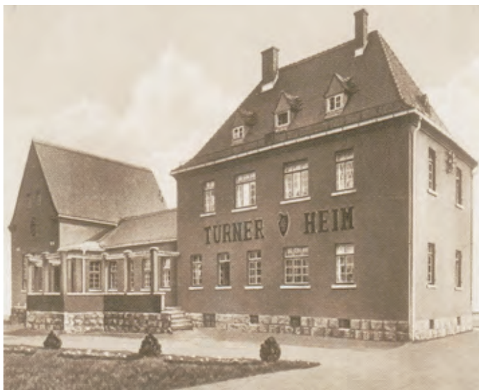
So sah es einmal aus – unser Turnerheim

Seit nunmehr zwei Jahren haben wir die Cainsdorfer Geschichte in unsrem Turnerheim aufgearbeitet und einzelnen Bereichen visualisiert. Dargestellt sind Teile der Industrie- und Handwerks-geschichte, der Kultur-, Vereins- Sportgeschichte und auch einiges zur Kommunal- und Verwaltungsgeschichte kann man erfahren. Durch Leihgaben und Spenden sind in der letzten Zeit viele interessante Exponate dazu gekommen, die Einblick geben in die bewegte Vergangenheit unseres Ortes bzw. Ortsteiles. Alle, die bisher da waren und das „Zimmer“ gesehen haben, waren begeistert. Leider ist der Zuspruch überschaubar. Dies ist nicht nur schade für die Macher, sondern es wird auch viel Bildungspotenzial etwa bei den Kindern, Jugendlichen und „Zugezogenen“ ver-tan.