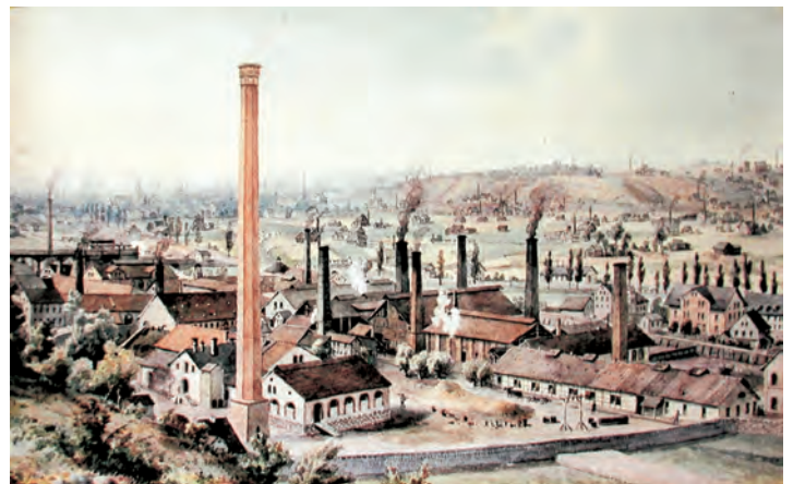
Königin-Marienhütte Cainsdorf vor ca. 180 Jahren

Neu hinzugekommen sind in den letzten Tagen bild- und kurze textliche Darstellungen zur Geschichte der in Cainsdorf gefertigten „Fördergerüste“. Man kann sich in der Tat kaum vorstellen, welche weitreichenden Wirkungen die Produkte der Königin Marienhütte in Deutschland und darüber hinaus hatten. Ergänzt wird dieser Teil durch die Broschüre „Historische Bauwerke, die mit Baugruppen aus Cainsdorf“ ausgestattet wurden. Nachweislich sind solche Baugruppen im „Alten Post- und Telegra-phenamt“, der Ditteschule, im „Alten Schlachthof“ Zwickau, der Kirche Sankt Jakobus in Reinsdorf, im Bahnhof Wilkau-Haßlau, am Viadukt Markersbach, Oberrabenstein, Oschütztal und Chemnitz, an der „Carola-Brücke“ und am Blauen Wunder in Dresden eingesetzt und verbaut worden. Es lohnt sich zu kom-